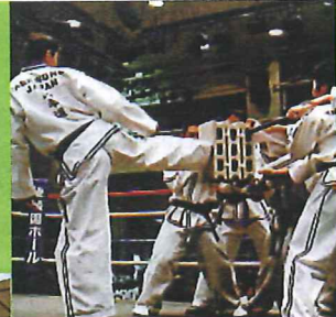
▲華麗な蹴りは、見た目より威力があり、大迫力。